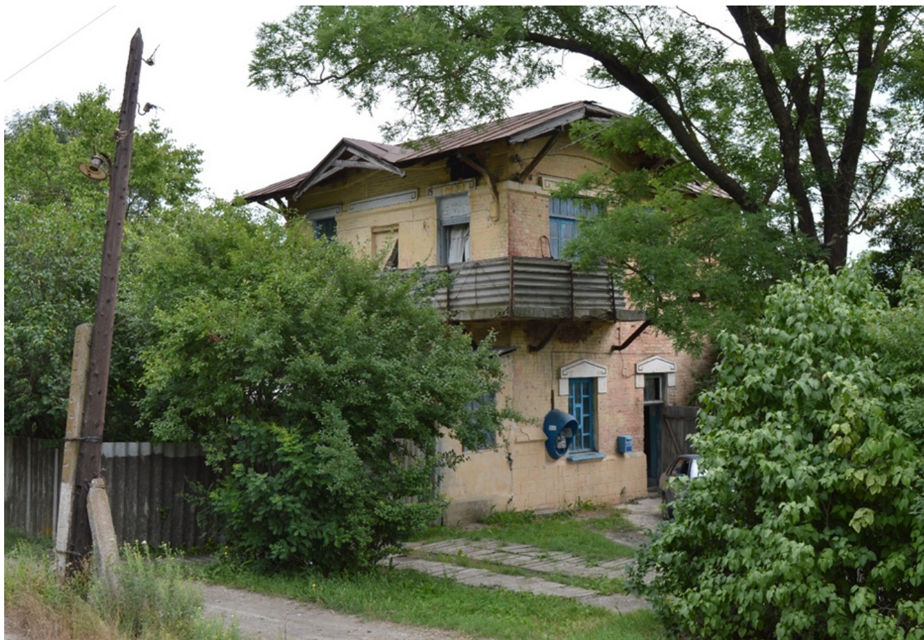
Здание бывшего разъезда Горный. Лето 2015 года

Однако мой интерес к здешним местам возник отнюдь не на религиозной почве. В мае 2015 года, по пути в Краснодар, в окно электрички я увидел здание, привлёкшее моё внимание. Это был двухэтажный домик затейливой архитектуры.